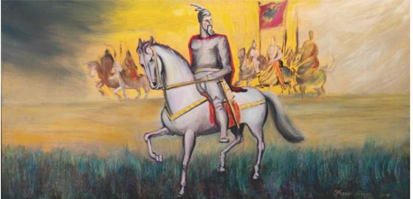
GJERGJ KASTRIOTI - SKENDERBEG KREÇE U BITKU