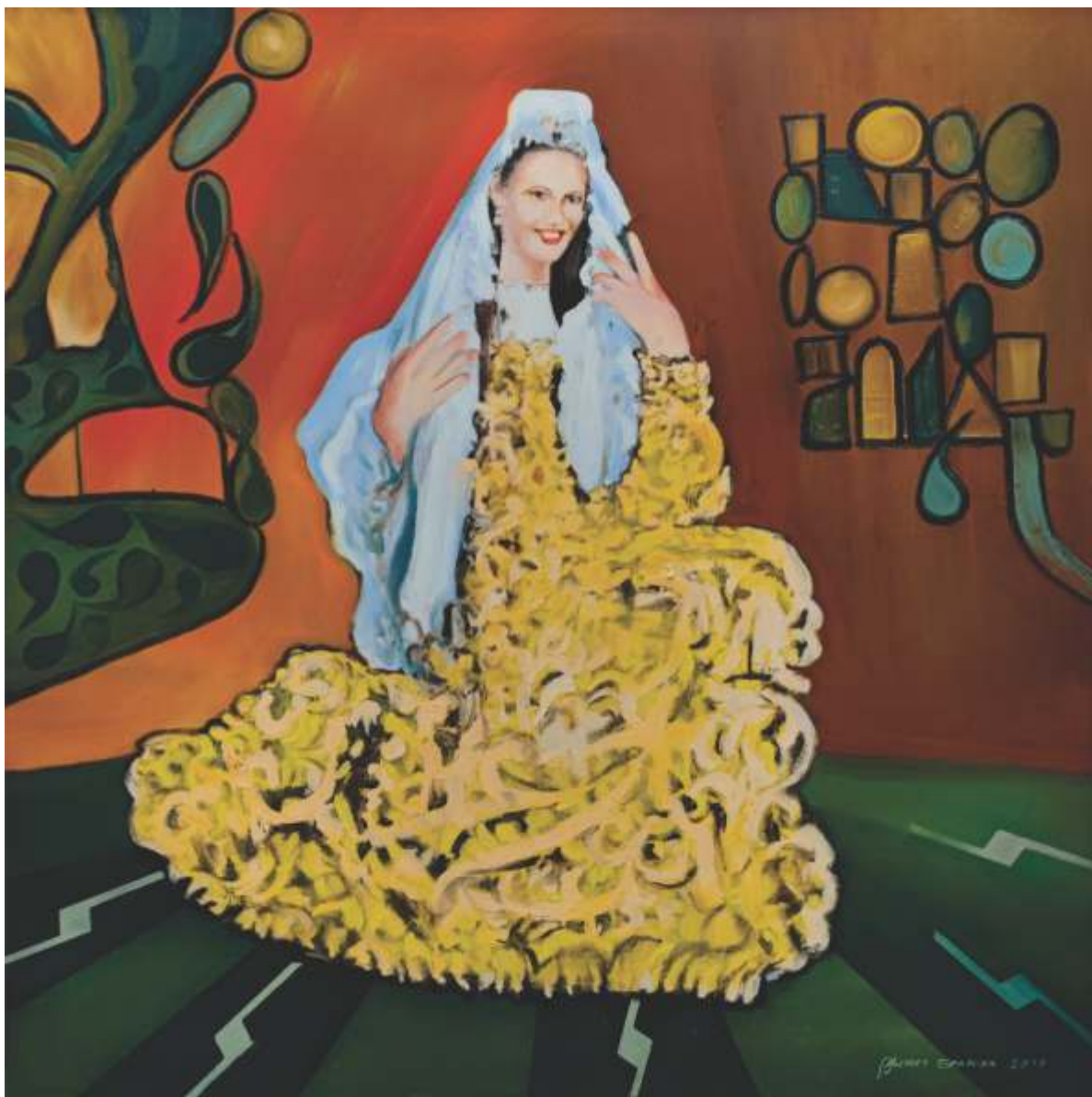
LJEPOTICA IZ DRAČA (Božica plodnosti)