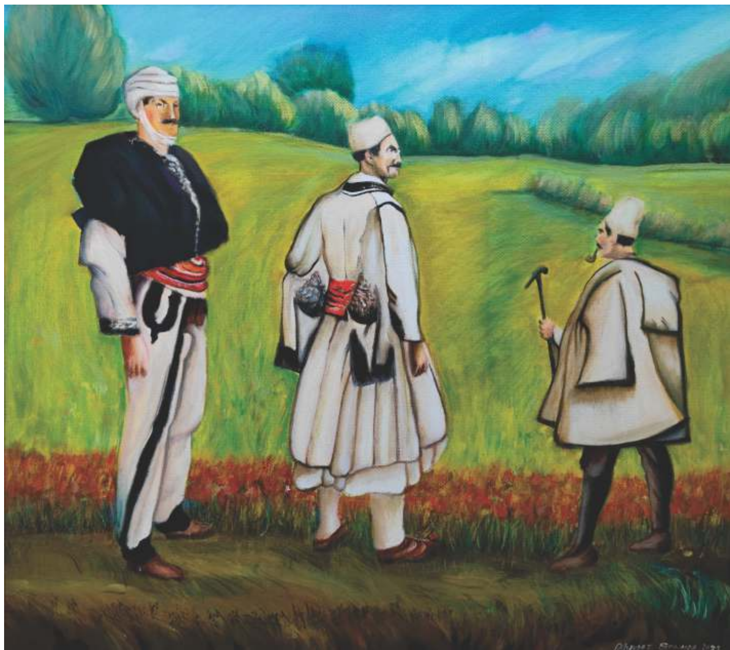
MUŠKA NARODNA NOŠNJA