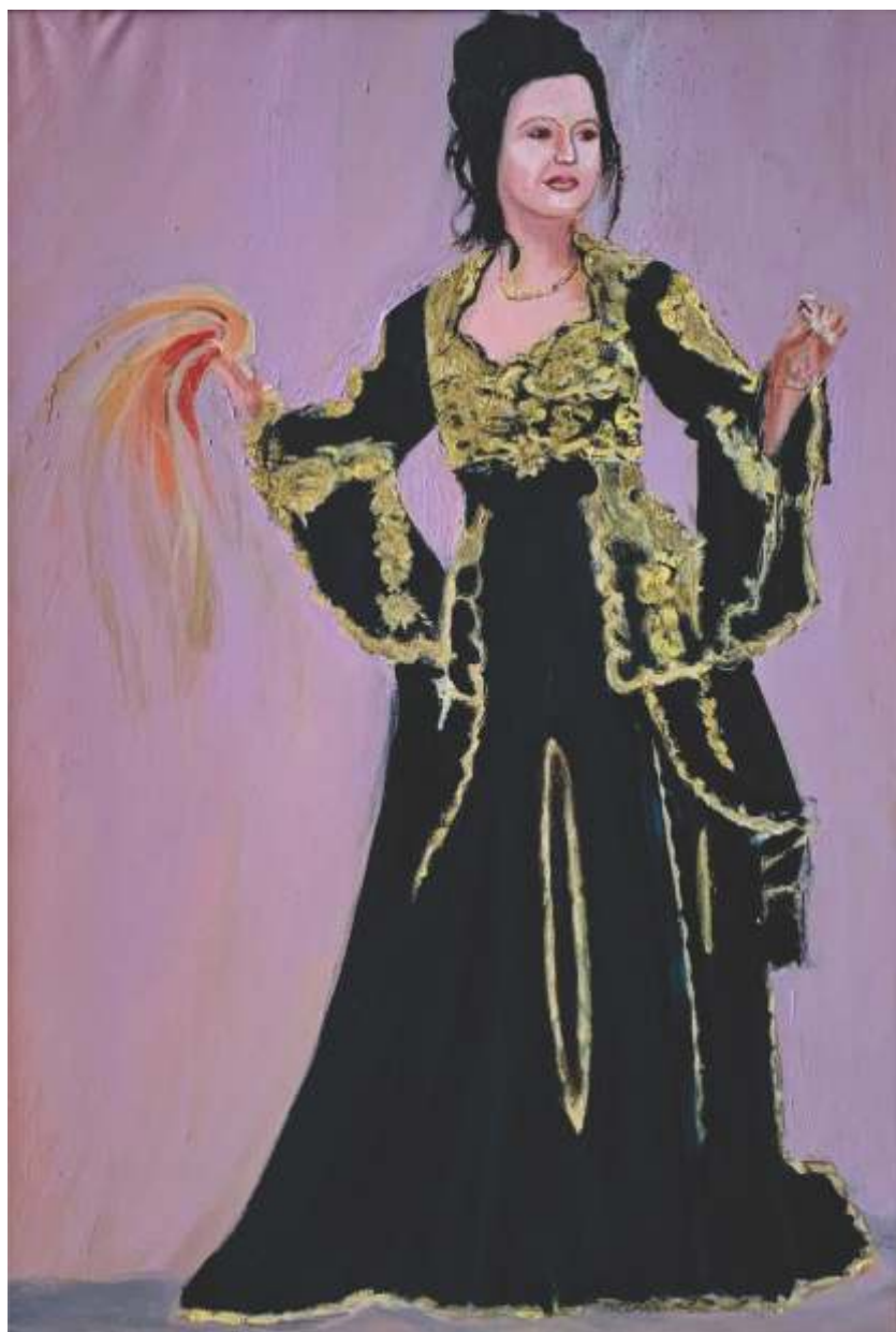
KOSOVSKA MLADENSKA NOŠNJA